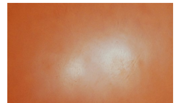
Valmis Tierrafino Listro pinta

Tämän käyttöohjeen on koontanut tuotteen valmistaja, Tierrafino B.V. äärimmäisen huolellisesti. Tierrafino B.V. tai Decos Oy eivät kuitenkaan ole vastuussa mistään suorasta tai epäsuorasta vahingosta, mikä voi sattua käytettäessä tässä olevia tietoja tuotteesta.