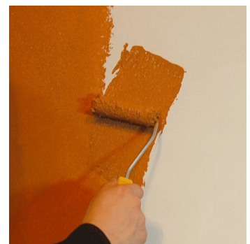
Tierrafino i-paint sisustusmaalin levitys telalla, 1. kerros.