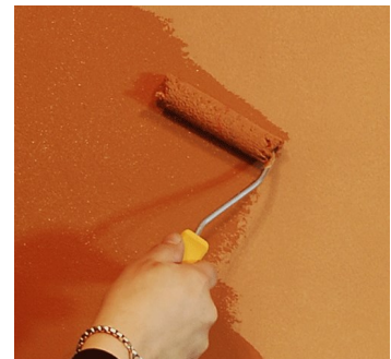
Tierrafino i-paint sisustusmaalin levitys telalla, 2. kerros.