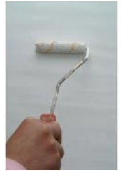
Pohjustaminen Decor Fondo primerilla