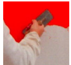
1.kerroksen levitys stuccolastalla