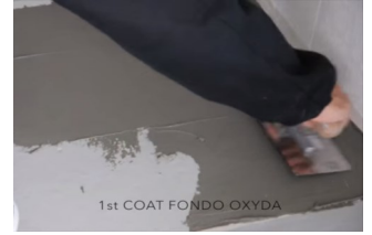
1kr Oxyda Fondo