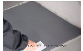
Kiillotus muovi- tai teräslastalla

Tämän käyttöohjeen on koontanut tuotteen valmistaja, Rivedil äärimmäisen huolellisesti. Rivedil tai Decos Oy eivät kuitenkaan ole vastuussa mistään suorasta tai epäsuorasta vahingosta, mikä voi sattua käytettäessä tässä olevia tietoja tuotteesta.