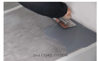
2 krs Oxyda