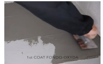
1 krs Oxyda