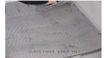
Verkko Oxyda Fondoon