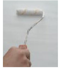
Pohjustus Hydro Fondo AM primerilla