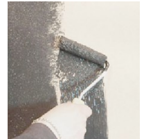
Pohjusta alusta sävytetyllä Decor Fondo Shiny primerilla

https://www.youtube.com/watch?time_continue=2&v=fgF43qFYB1U