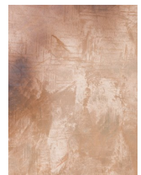
Valmis Persia pinta

Tämän käyttöohjeen on koontanut tuotteen valmistaja, Rivedil äärimmäisen huolellisesti. Rivedil tai Decos Oy eivät kuitenkaan ole vastuussa mistään suorasta tai epäsuorasta vahingosta, mikä voi sattua käytettäessä tässä olevia tietoja tuotteesta.