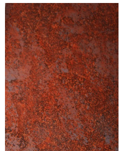
Valmis Rouge pinta