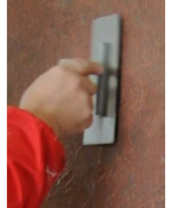
Tasoita pinta kevy- esti metallilastalla