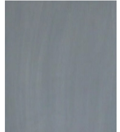
Pohjusta alusta Rouge primerilla kahteen kertaan

Tämän käyttöohjeen on koonnut tuotteen valmistaja, Rivedil äärimmäisen huolellisesti. Rivedil tai Decos Oy eivät kuitenkaan ole vastuussa mistään suorasta tai epäsuorasta vahingosta, mikä voi sattua käytettäessä tässä olevia tietoja tuotteesta.