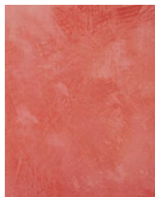
Valmis Stile Barocco pinta viimeistely hiomalla