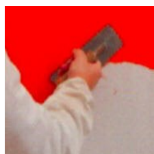
1.kerroksen levitys stuccolastalla