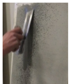
Lisätiivistäminen kostuttamalla pintaa