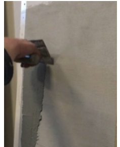
1. krs levitys teräslastalla