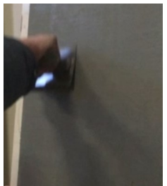
Pinnan tiivistys teräslastalla