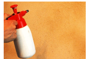
Pinnan kostutus vedellä