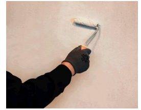
Pohjustus Contact Fine primerilla

Tämän käyttöohjeen on koonnut tuotteen valmistaja, Tierrafino äärimmäisen huolellisesti. Tierrafino tai Decos Oy eivät kuitenkaan ole vastuussa mistään suorasta tai epäsuorasta vahingosta, mikä voi sattua käytettäessä tässä olevia tietoja tuotteesta.