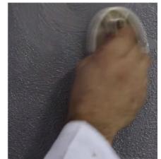
1.kerroksen Kuviointi Nuvola työkalulla