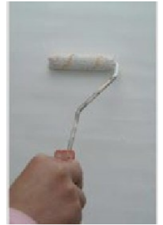
Pohjustaminen Decor Fondo primerilla