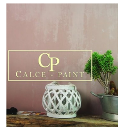
Valmis Calce Paint