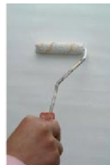
Pohjustaminen Decor Fondo primerilla