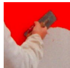
1.kerroksen levitys stuccolastalla