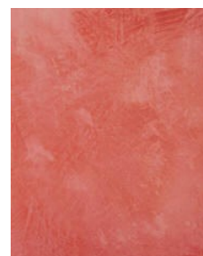
Valmis Stile Barocco pinta viimeistely hiomalla

Tämän käyttöohjeen on koontanut tuotteen valmistaja, Rivedil äärimmäisen huolellisesti. Rivedil tai Decos Oy eivät kuitenkaan ole vastuussa mistään suorasta tai epäsuorasta vahingosta, mikä voi sattua käytettäessä tässä olevia tietoja tuotteesta.