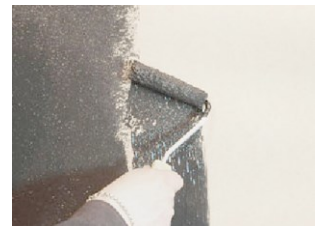
Pohjista Decor Fondo Nero primerilla