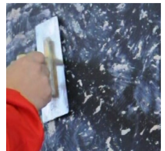
Riko maalin helmiäiskaumat teräslastalla halutun suuntaisesti.