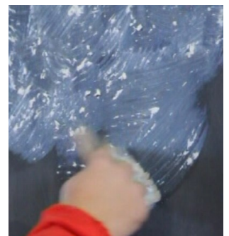
Levitä sisustusmaali erikoissiveltimellä