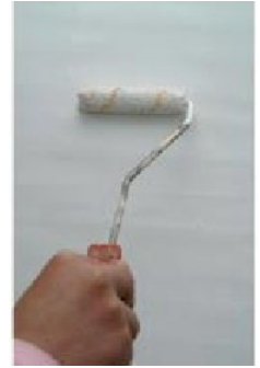
Pohjustaminen Decor Fondo primerilla