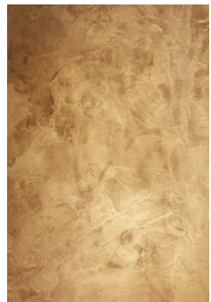
Valmis Sinfonia Gold + TDM