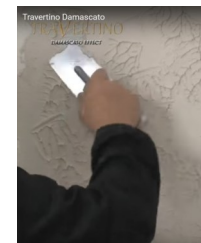
Pinnan painelu Stuccolastalla, teollinen pinta

Tämän käyttöohjeen on koennut tuotteen valmistaja, Rivedil äärimmäisen huolellisesti. Rivedil tai Decos Oy eivät kuitenkaan ole vastuussa mistään suorasta tai epäsuorasta vahingosta, mikä voi sattua käytettäessä tässä olevia tietoja tuotteesta.