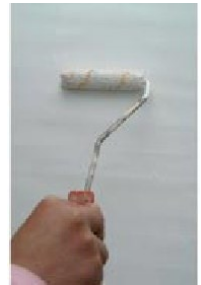
Pohjustaminen Decor Fondo primerilla

https://www.youtube.com/watch?v=zrB3_o2T-h8